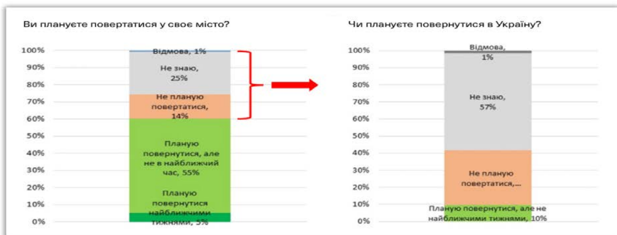
Рисунок 2 – Частка біженців, які планують або не планують повертатися

Така низка невирішених питань потребує кардинальних змін на ринку праці, зокрема державного втручання у механізми регулювання ринку праці. Отже втручання держави повинно відбуватися на трьох рівнях: юридичному, соціальному та фінансовому.