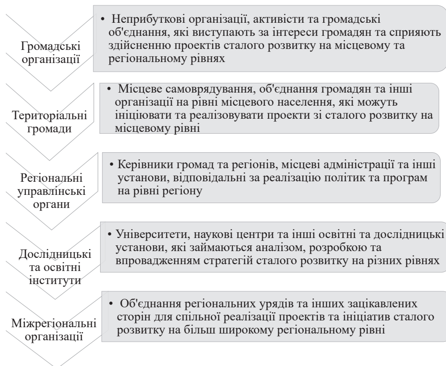
Рисунок 1 – Інституції забезпечення сталого розвитку на регіональному рівні та рівні територіальних громад