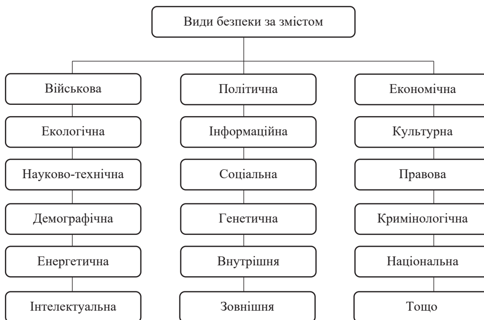
Рисунок 1 – Види безпеки за змістом