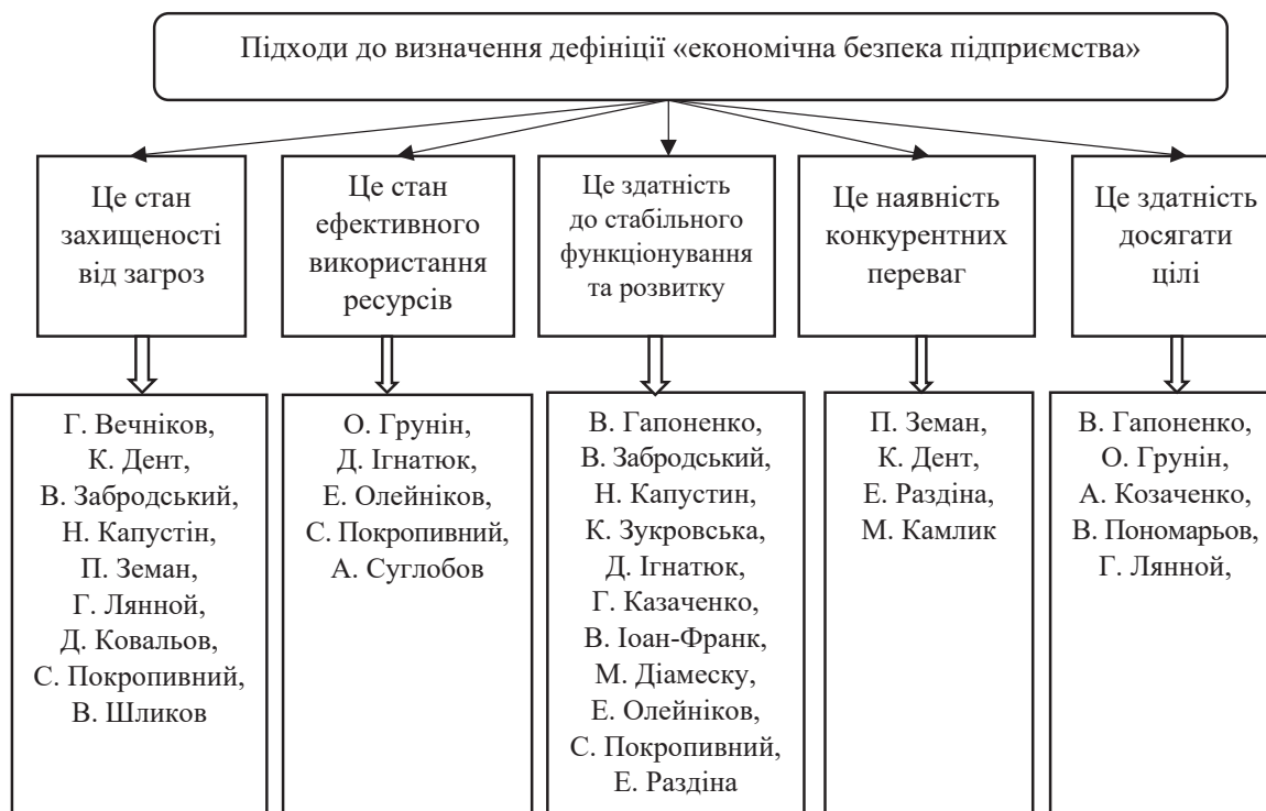
Рисунок 3 – Підходи до визначення поняття «економічна безпека підприємства»

На основі комплексного аналізу наукової літератури вітчизняних та закордонних вчених було систематизовано та виявлено основні підходи до визначення сутності економічної безпеки підприємства.