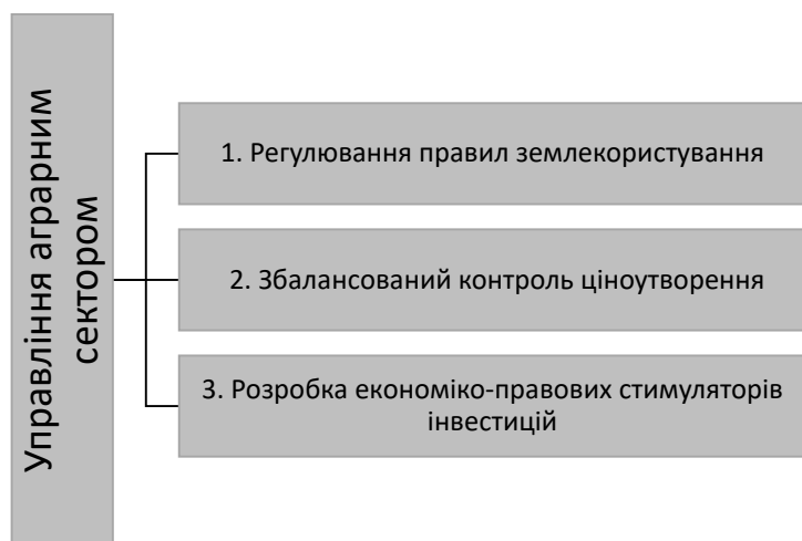
Рисунок 3 – Основні напрями стратегічного управління аграрним сектором економіки для підвищення експорту

Також вважаємо, що ключовими передумовами для відновлення України та приваблення інвестицій є її приєднання до НАТО та ЄС. Повне членство в цих об'єднаннях гарантуватиме посилення національної безпеки та відкриватиме доступ до нових ринків збуту і визначає необоротність важливих інституційних реформ.