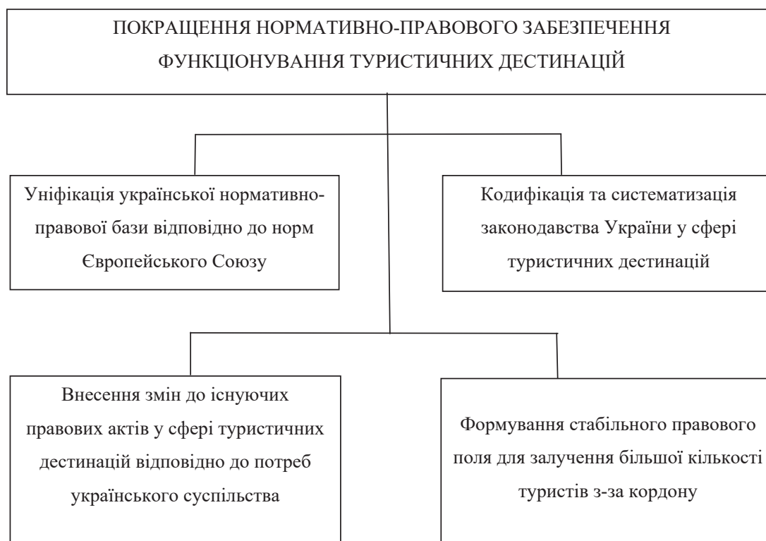
Рисунок 3 – Покращення нормативно-правового забезпечення функціонування туристичних дестинацій у напрямі їх інноваційного розвитку