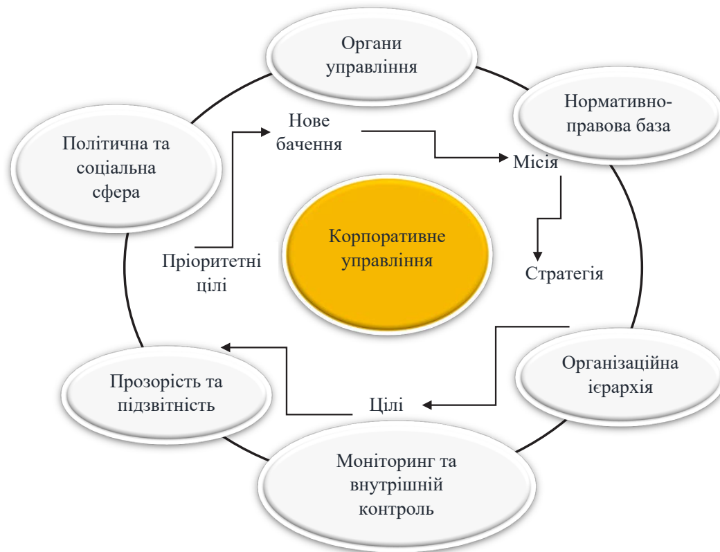
Рисунок 2 – Стандарти ефективного корпоративного управління в життєдіяльності підприємства