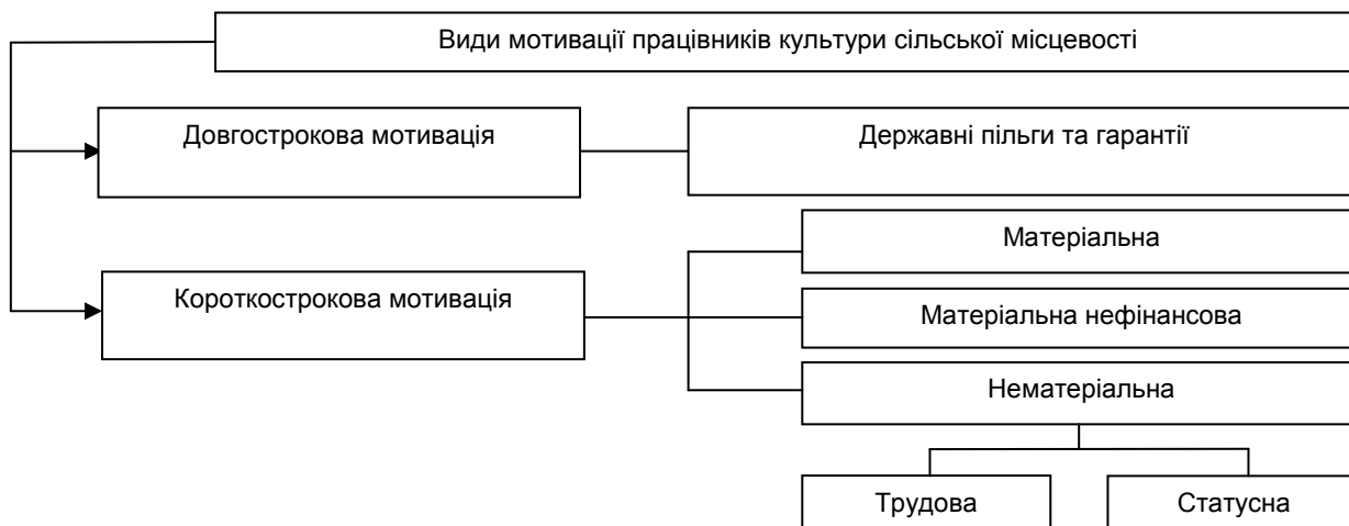
Рис. 1. Види мотивації персоналу

Пропонується методика оцінки особистого внеску в діяльність та розвиток закладів культури сільської місцевості, що в результаті дозволить оцінювати показники роботи працівника і одночасно розвивати його потенціал. У розробці нашої методики використані саме ті показники оцінки, які більш-менш об'єктивно дозволяють оцінити успішність діяльності працівника, його професіональність, компетентність, творчу активність та індивідуально-професійні якості, що в результаті стане підґрунтям для системи мотивації праці у закладах культури сільської місцевості.