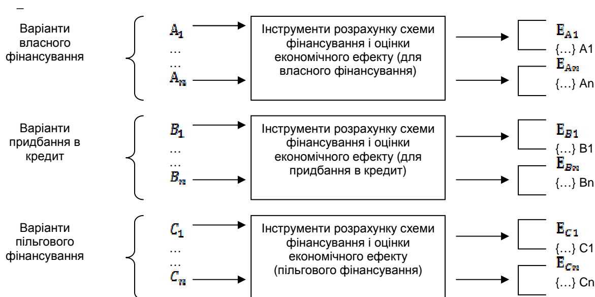
Рис. 1. Загальна схема вибору оптимального джерела інвестування

– відповідності обраному способу k схемі фінансування даного інвестиційного проекту.