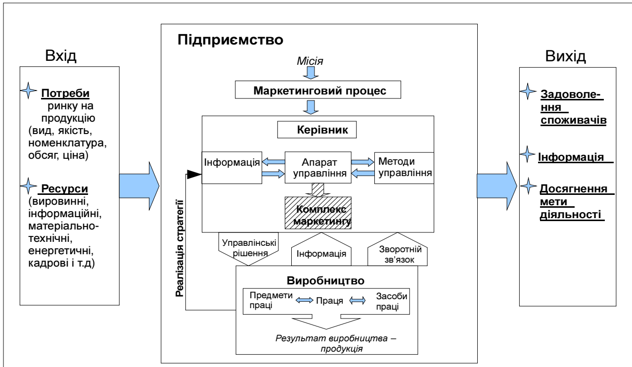
Рис. 1. Маркетинговий процес діяльності малих підприємств.