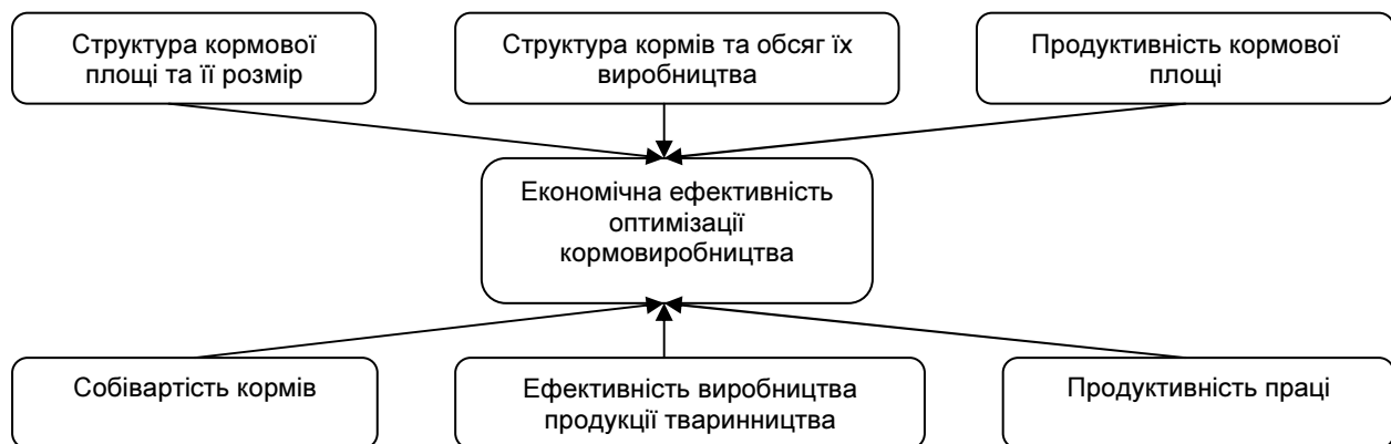
Рис. 2. Схема показників економічної ефективності кормовиробництва

Проте, рівень інтенсивності кормовиробництва залежить не лише від урожайності. Суттєвий вплив на нього має структура кормової площі. Тому, не применшуючи значення агробіологічних чинників, важливим напрямом інтенсифікації кормовиробництва є його оптимізація, яка враховує комплекс чинників і заходів у галузі (рис. 2).