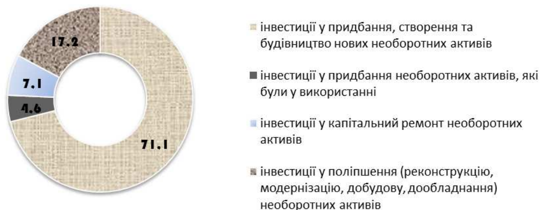
Рис. 1. Структура капітальних інвестицій в Україні за формами відтворення за 2014 р., %

вага яких склала понад 96%. Найбільшу частку серед них зайняли: машини, обладнання та інвентар – 32%, інженерні споруди – 23%, нежитлові будівлі – 17% та житлові будівлі – 16% (рис. 2).