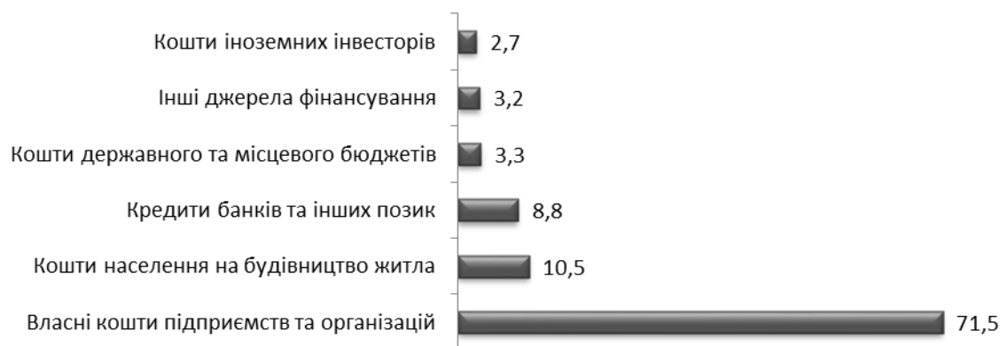
Рис. 3. Структура капітальних інвестицій в Україні за джерелами фінансування за 2014 р., %