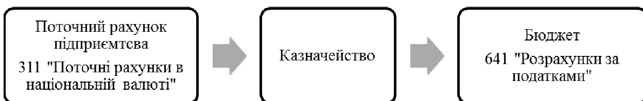
Рис. 2. Схема сплати податкового зобов'язання з ПДВ після 01.02.2015 р.