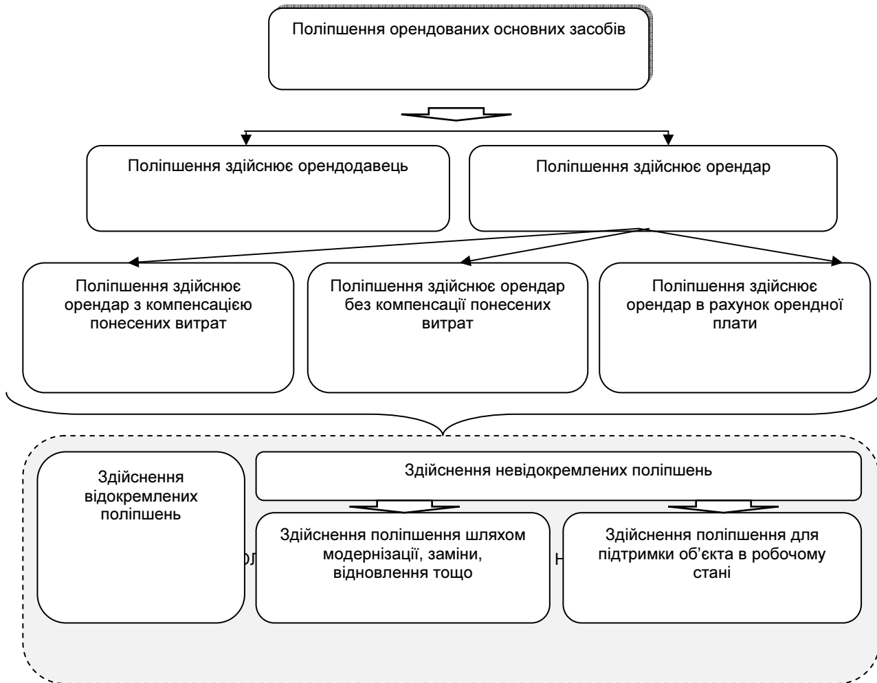
Рис. 1. Класифікація видів поліпшення орендованих об'єктів нерухомості за джерелами їх фінансування