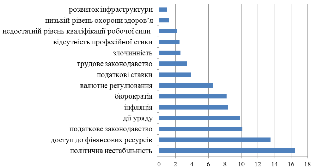
Рис. 2. Характеристика факторів, що заважають розвитку бізнесу в Україні

Щорічно Світовий економічний форум проводить опитування, згідно якого серед факторів, що мають найбільший вплив на розвиток бізнесу в Україні є: політична нестабільність (16,5%), а найменший – розвиток інфраструктури (1,0%) (рис. 2).