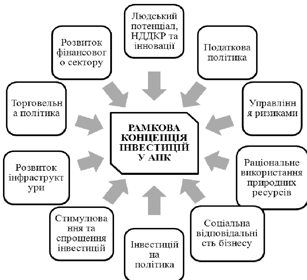
Рис. 1. Базові елементи Рамкової концепції інвестицій в АПК