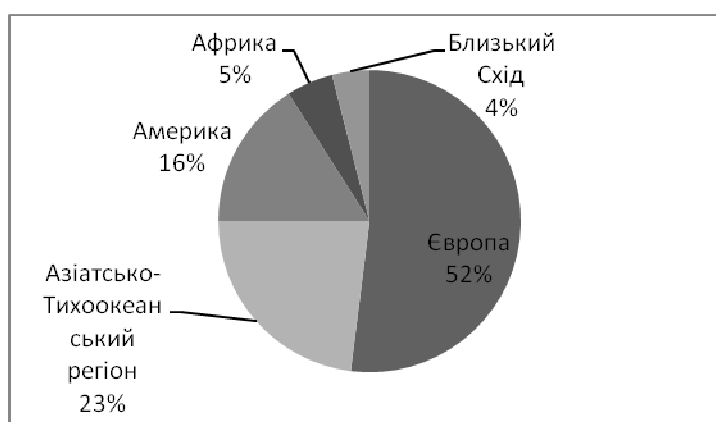
Рис. 1. Частка туристських прибуттів основних макрорегіонів світу, %

У структурі міжнародних прибуттів за основними макрорегіонами світу частка Американського регіону є доволі значною і у 2013 р. складала 16% (рис. 1).