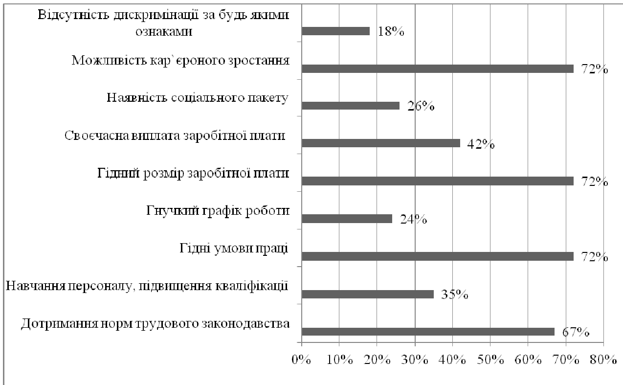
Рис. 2. Розподіл відповідей щодо вимог респондентів до роботодавця