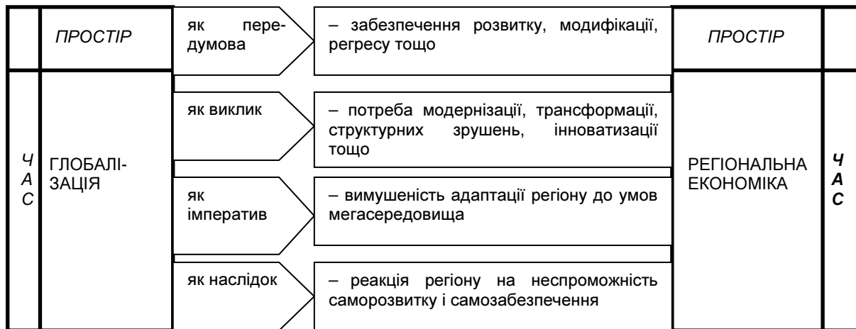
Рис. 2. Функціонально-змістовні зрізи дослідження впливу глобалізації на розвиток регіональної економіки

Вплив глобалізації на розвиток економіки як регіональної підсистеми може набувати різних функціонально-змістовних ознак, що відображено на рис. 2.