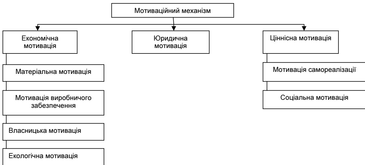
Рис. 1. Структура мотиваційного механізму

Виділені підсистеми моделі підприємства з необхідністю потребують використання принципів системного підходу до побудови моделі мотиваційного механізму. На нашу думку, дієвий мотиваційний механізм повинен базуватися на трьох основних структурних елементах: економічна мотивація, юридична мотивація та ціннісна мотивація (див. рис.1).