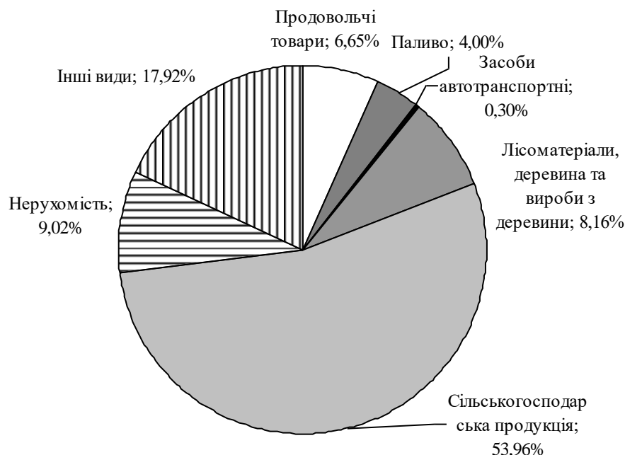
Рис. 1. Структура укладених угод за товарними групами на біржах України у 2014 році

комунальне майно, що перебуває в державній власності; майно, заставлене в банках та інших фінансових установах; конфісковане та безхазяйне майно, що перейшло в державну власність. Так, у 2014 році укладено 9% біржових угод з нерухомістю, 6,65% – з продовольчими товарами, лише 4% з паливом (рис. 1).