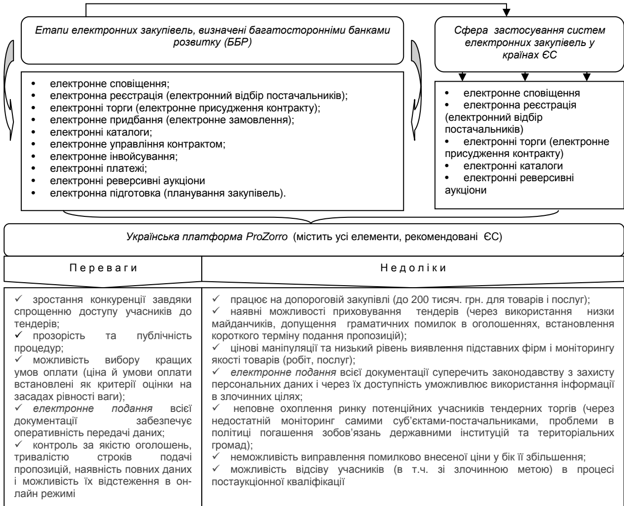
Рис. 1. Основні переваги та недоліки електронної системи публічних закупівель ProZorro

Якщо інтерпретувати вищенаведене означення з точки зору учасника торгів (у ролі надавача пропозицій з питань поставок товарів, робіт чи послуг), то такий контроль слід віднести до категорії внутрішнього. Тобто його завданням є пошук компромісного рішення, прийняттого та вигідного для обох суб'єктів торгів. Можливо пропоноване трактування є дискусійним, однак в пересічному розумінні (на рівні простого користувача не юридичного профілю), воно не дає вичерпної однозначної думки та виглядає недостатньо пов'язаним з рештою рекомендацій, зокрема щодо суб'єктів реалізації державної політики у сфері державного фінансового контролю.