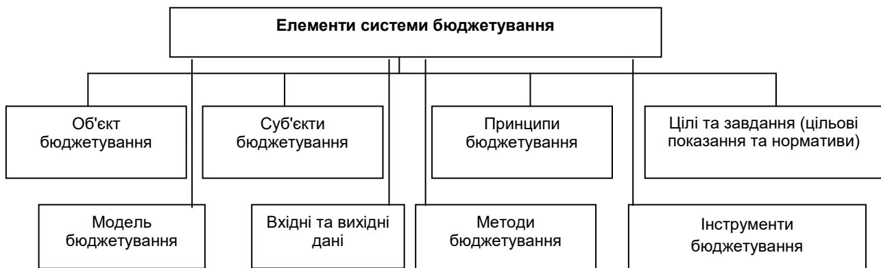
Рис. 1. Основні елементи системи бюджетування

Систему загального бюджетування вважають засобом постановки та конкретизації короткострокових завдань у межах загального стратегічного плану, важливим засобом для реалізації таких функцій управління, як планування та контроль, що зображено на рис. 1 [7, с. 213].