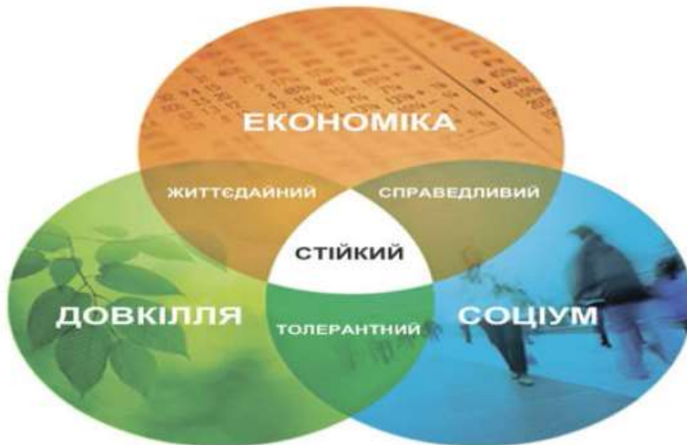
Рис. 1. Три складові «сталого розвитку»: суспільство, економіка і екологія

Концепція «сталого розвитку» (англ. «sustainable development») набуває великої популярності у світі у зв'язку з необхідністю встановлення балансу між задоволенням сучасних потреб людства та захистом інтересів майбутніх поколінь, включаючи їх потребу в безпечному й здоровому довкіллі. Концепція включає три складові: суспільство, економіку і екологію (рис. 1).