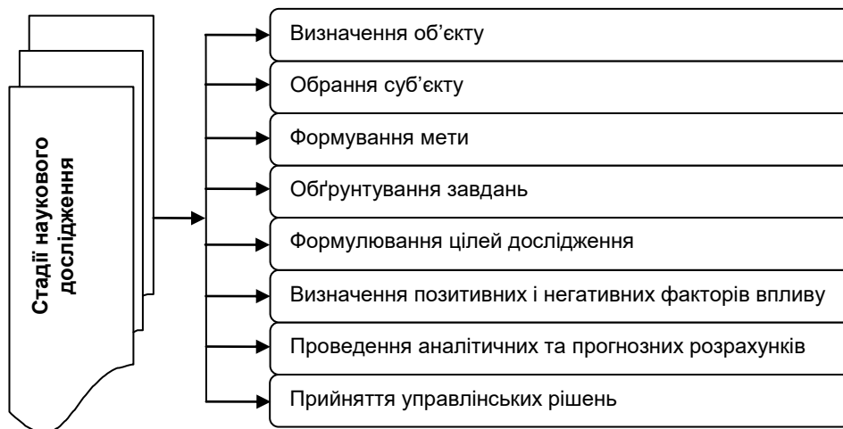
Рис. 2. Схема стадій дослідження розвитку сільських територій

Запропонована схема застосування методології дослідження розвитку сільських територій повинна бути підпорядкована логічній послідовності дій, які, на нашу думку, слід об'єднати за певними стадіями наукового дослідження (рис. 2).