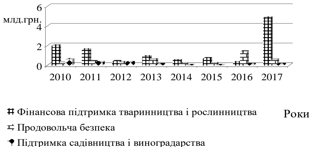
Рис. 3. Виробничі субсидії сільському господарству з Державного бюджету

Витрати (виробничі субсидії) «жовтої скриньки» здійснюються у вигляді безпосередньої фінансової допомоги підприємствам і податкових пільг та фінансової допомоги у формі зменшення податкових витрат підприємств (рис. 3).