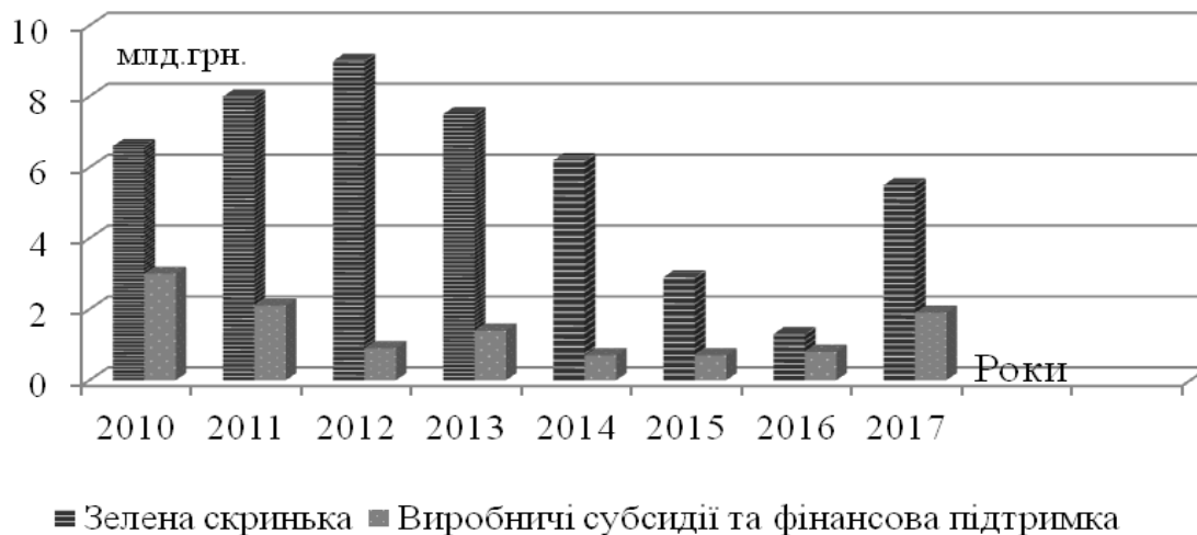
Рис. 1. Витрати державного бюджету України на розвиток сільського господарства Джерело: [9]

Після вступу України до СОТ дискусійними є заходи щодо потреби класифікувати заходи державного фінансування видатків на розвиток сільського господарства відповідно до критеріїв і вимог «зеленої», «жовтої» або «блакитної скриньки». За цей період витрати на заходи «зеленої скриньки» зросли до 9 млрд. грн. у 2012 р., але після цього почали поступово знижуватися у зв'язку з погіршенням ситуації у країні, яка викликала дефіцит коштів бюджету. На 2017 р. передбачається збільшення бюджетних коштів на заходи «зеленої скриньки» (рис. 1).