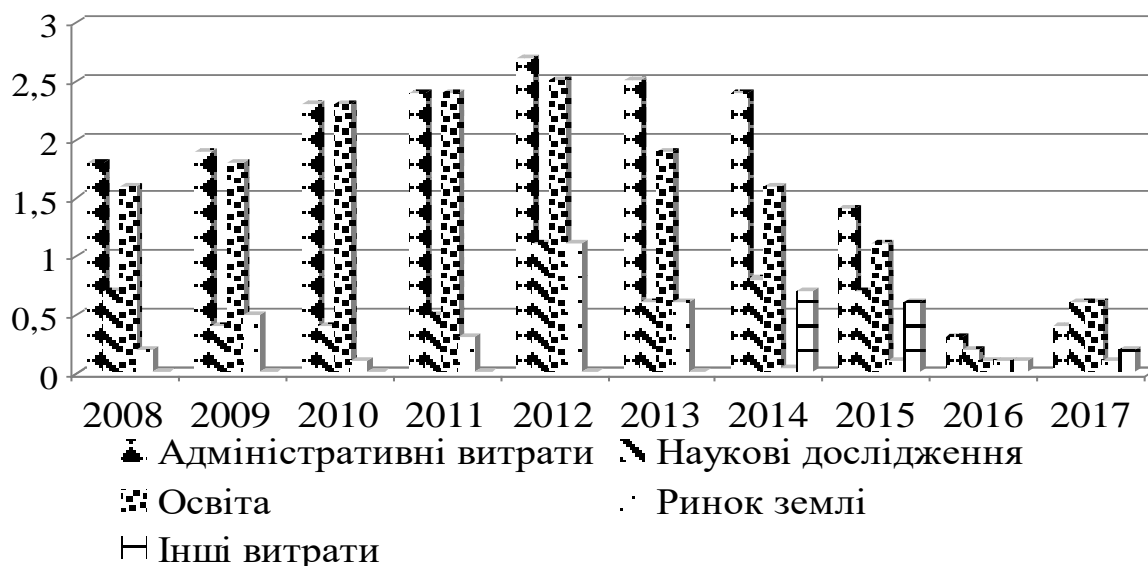
Рис. 2. Складові витрат «зеленої скриньки»

Зазвичай бюджетні видатки, що не забезпечують підтримку обсягів виробництва продукції і цін сільськогосподарських товаровиробників, відносяться до «зеленої скриньки» та «блакитної скриньки». До них включаються наукові дослідження, створення резервів продуктів, підготовка кадрового складу, розбудова інфраструктури, програми охорони довкілля (рис. 2).