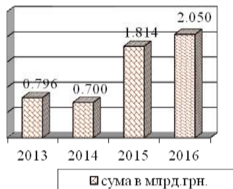
Рис. 2. Динаміка грошової оцінки митних правопорушень за 2013-2016 рр.