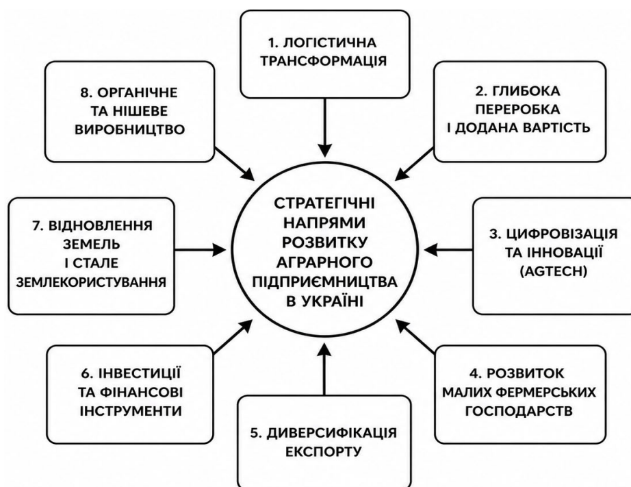
Рисунок 2 – Стратегічні напрями розвитку потенціалу аграрного підприємництва України