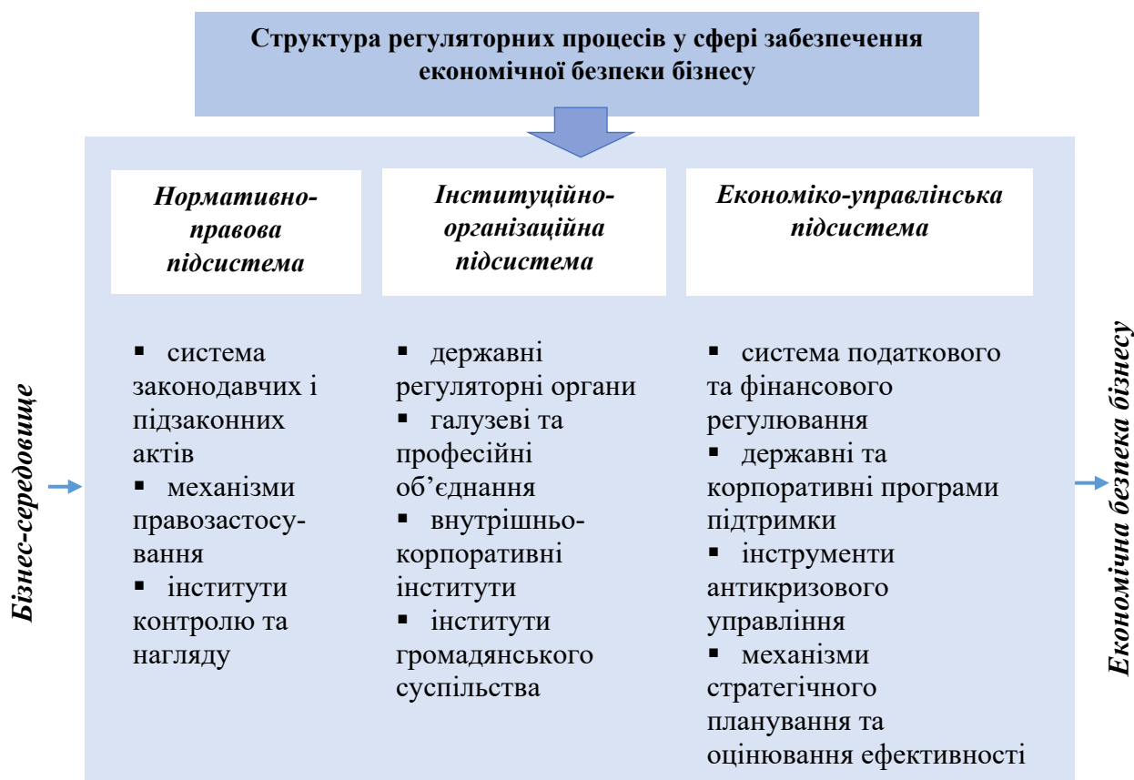
Рисунок 1 – Структура регуляторних процесів у сфері забезпечення економічної безпеки бізнесу