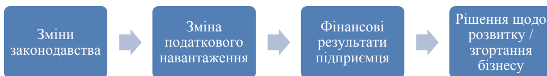
Рисунок 3 – Вплив змін у спрощеній системі оподаткування на бізнес

Враховуючи особливості, переваги та недоліки спрощеної системи оподаткування можна дійти висновків щодо проблем у цій сфері оподаткування, а саме: неузгодженість нормативно-правової бази оподаткування, недосконалість механізму нарахування та стягнення єдиного податку, адже він по суті не є єдиним – платники сплачують і інші платежі (ПДВ, ЄСВ тощо); неможливість