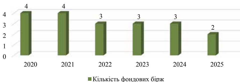
Рисунок 2 – Кількість фондових бірж в Україні в період 2020–2025 рр.