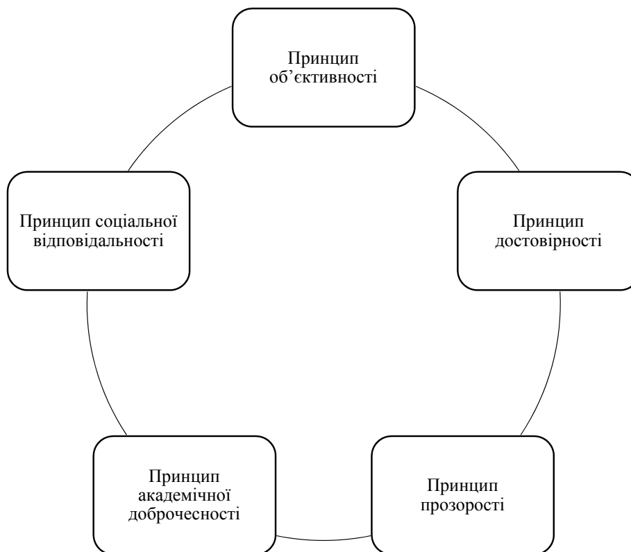
Рисунок 2 – Етичні принципи економічних досліджень

Конфлікт інтересів. Якщо дослідження фінансується корпорацією чи політичною силою, виникає ризик упередженості. Методологія вимагає обов'язкового розкриття джерел фінансування (Disclosure).