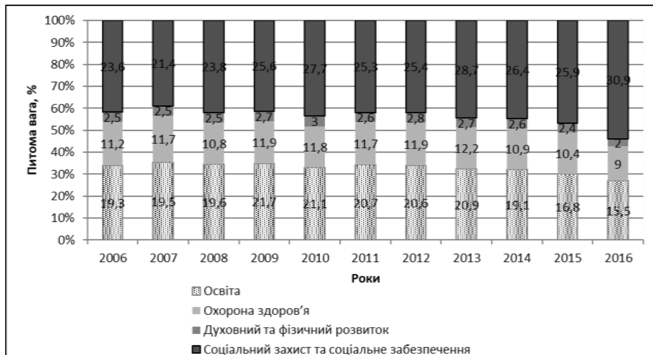
Рис. 2. Структура видатків з державного бюджету на людський розвиток за 2006–2016 рр.

Проаналізуємо структуру видатків з Державного бюджету на людський розвиток за 2006–2016 рр. (рис. 2).