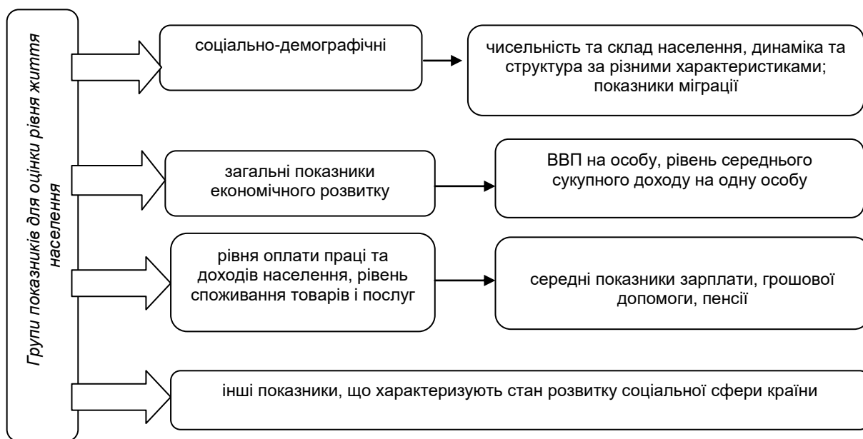
Рис. 2. Групи показників для оцінки рівня життя населення