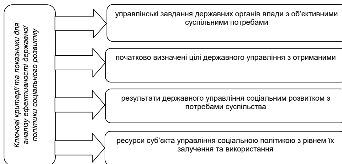
Рис. 1. Ключові критерії та показники для аналізу ефективності державної політики соціального розвитку

Зазначимо, що при аналізі ефективності державної політики соціального розвитку беруться для порівняння різні критерії та показники, ключові з яких представлені на рис. 1.