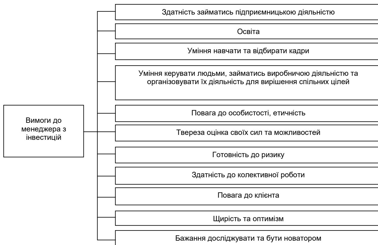
Рис. 3. Вимоги до менеджера з інвестицій

Закладу готельно-ресторанної сфери необхідно обрати такого інвестиційного менеджера, який повинен відповідати певним вимогам (рис. 3).