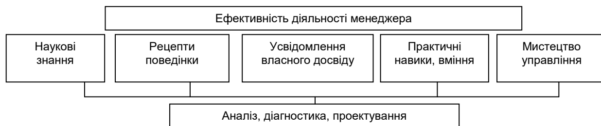
Рис. 2. Принципи роботи менеджера з інвестицій