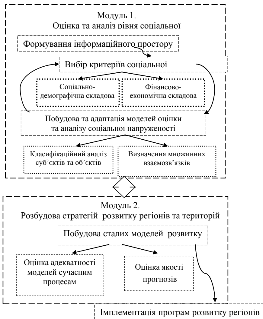
Рисунок 3 – Концептуальна модель дослідження соціальної напруженості