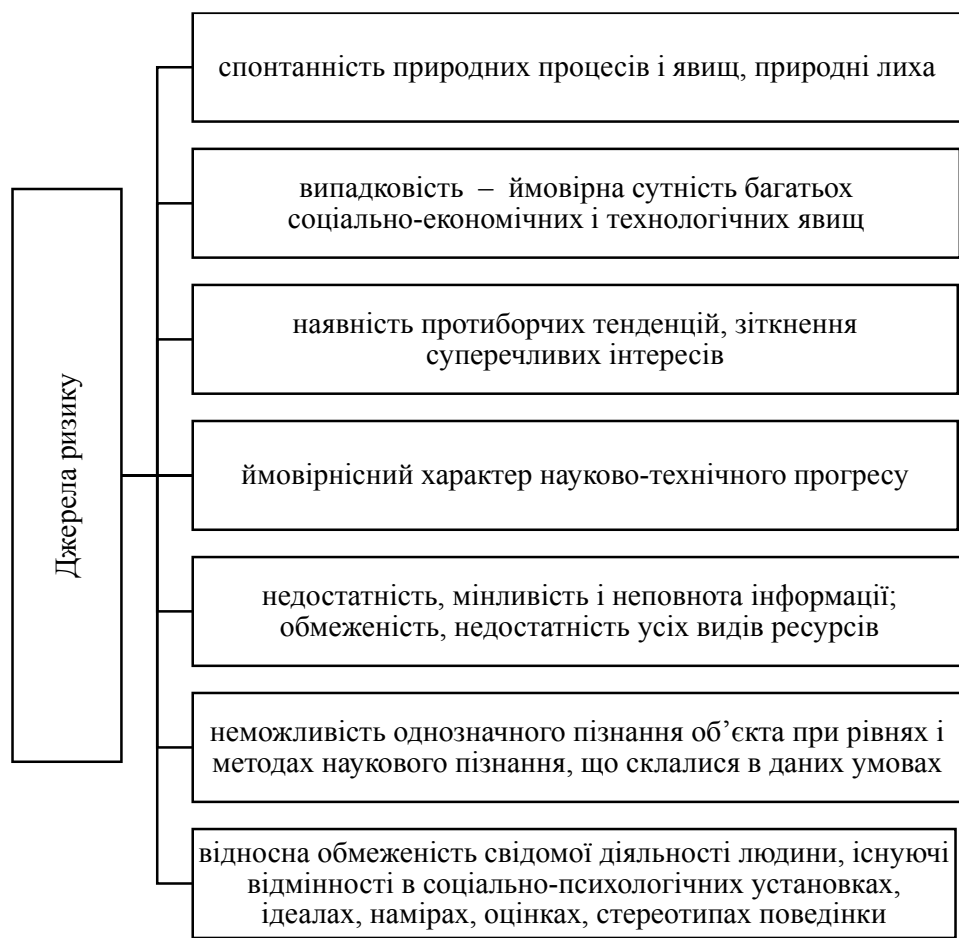
Рисунок 2 – Джерела ризику