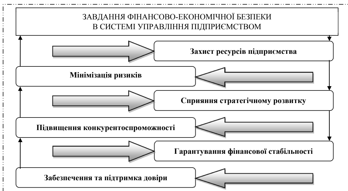
Рисунок 2 – Завдання фінансово-економічної безпеки в системі управління підприємством