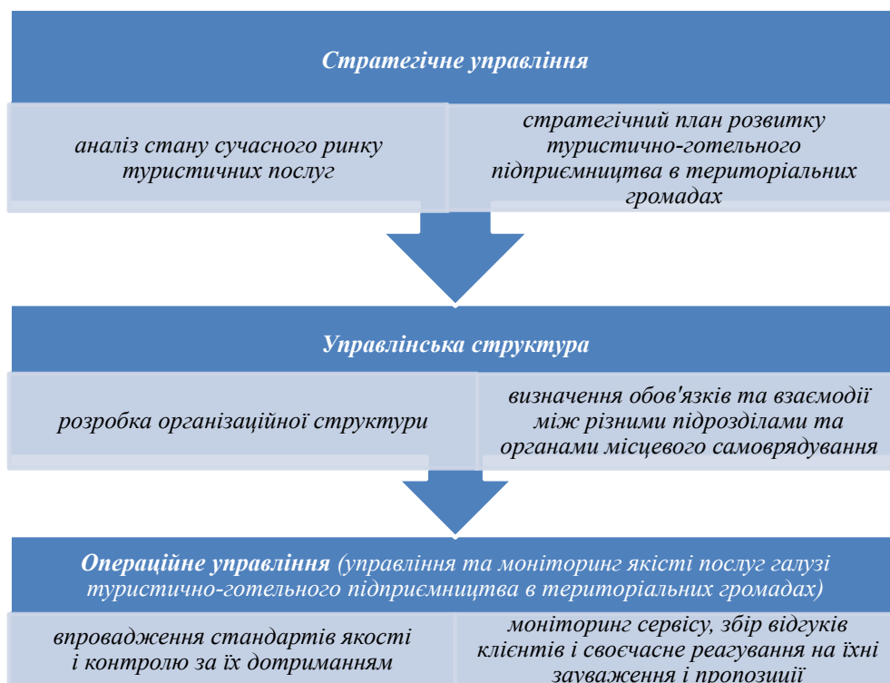
Рисунок 2 – Основні аспекти стратегічного управління розвитком туристично-готельного підприємництва в територіальних громадах

6. Робота з персоналом персонал: рекрутинг, навчання і мотивація персоналу. Складання ефективної програми підбору кадрів і забезпечення їхнього професійного розвитку є ключовими аспектами для забезпечення високого рівня обслуговування.